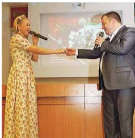
Вокалисты КЦ «Сибирь» с песней про дружбу сорвали бурю оваций