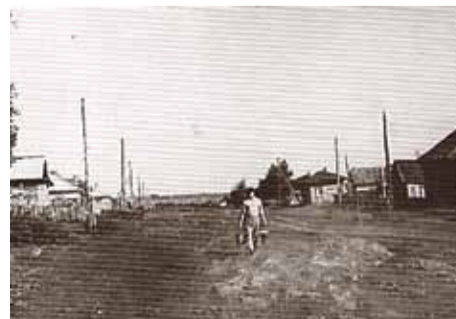
Улица Колхозная, 1958 год