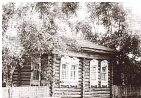
Первое здание сельсовета

Но всё-таки главное достояние Верх-Тулы — это сами жители. Сельчане всегда включаются в различные мероприятия, активно участвуют в общественной жизни муниципального образования. Кто-то входит в женсовет или совет ветеранов, кому-то нравится заниматься в танцевальном коллективе «Верх-Тулинка», другие поют в ансамбле народной песни «Радуга». Но каждый из жителей — частица целого поселения и несёт в себе его трёхвековую историю: горести и радости, победы и неугасающее желание идти вперёд и непрерывно развиваться.