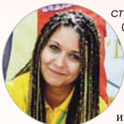
студентка НЮИ, филиал ТГУ (пос. Кудряши)