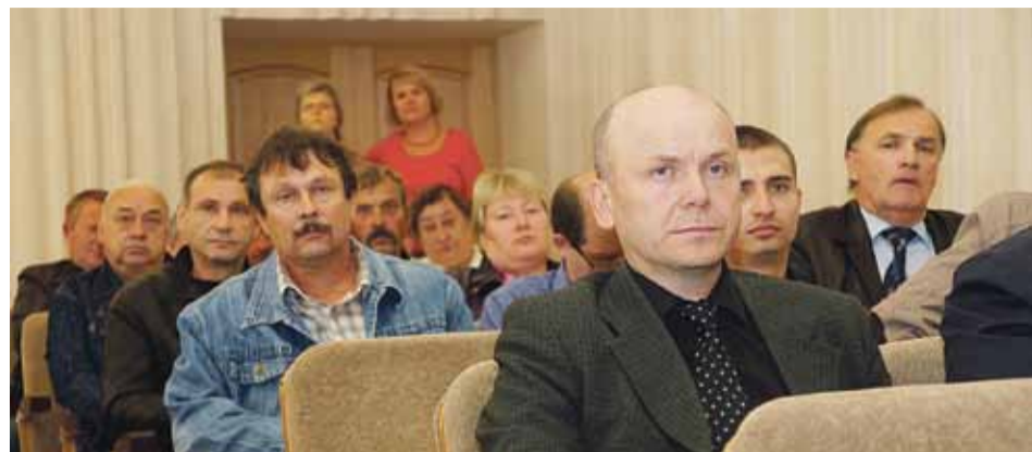
Медали получили 60 участников войны в Афганистане

В этот день награды получили более 60 ветеранов боевых действий. Многие пришли с жёнами и детьми. На лицах некоторых афганцев читалось, насколько им тяжело воспоминания. Другие были рады возможности встретиться